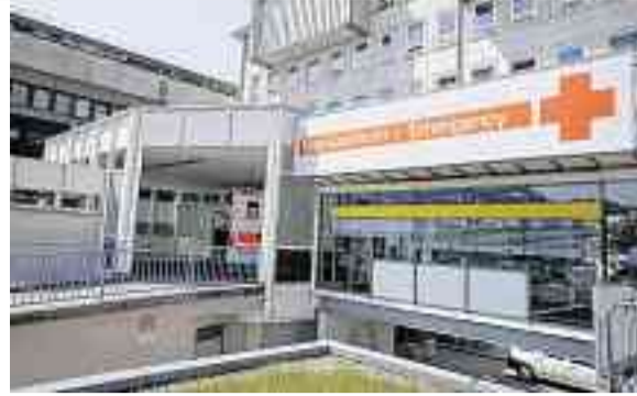
Das Klinikum rechts der Isar der TU München.