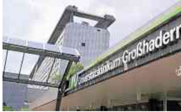
Klinikum der Universität München: Standort Großhadern.