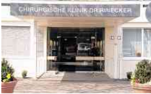
Die Chirurgische Klinik Dr. Rinecker in Thalkirchen.