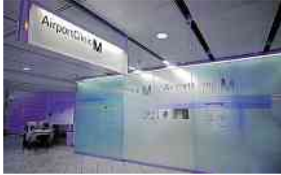
Die Airport-Clinic am Flughafen München.