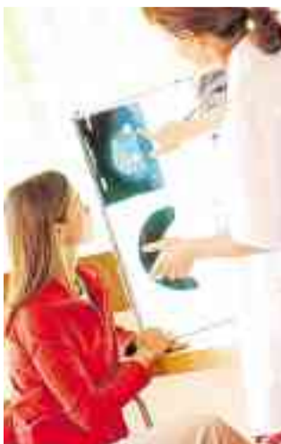
Eine Ärztin erklärt einer Patientin die Bilder ihrer Mammografie.